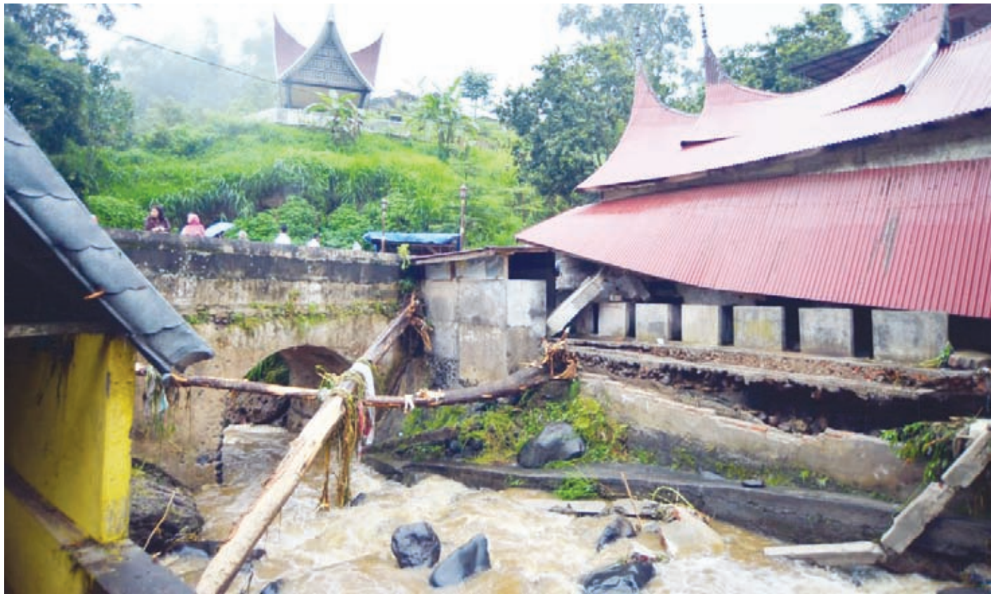
BANJIR BANDANG: Warga melihat bangunan rusak akibat banjir bandang di Nagari Pariangan, Tanah Datar, Sumatera Barat, Rabu (6/12/2023). Hujan lebat yang mengguyur hulu sungai lereng Gunung Marapi mengakibatkan banjir bandang menerjang sejumlah nagari di kabupaten itu.

Sejak Indonesia merdeka 78 tahun lalu, sambung dia, belum ada provinsi di Indonesia yang bebas dari inflasi cabe. Dia mengklaim, produksi cabe di Sulsel cukup besar, karena komoditas tersebut ditanam di banyak daerah.