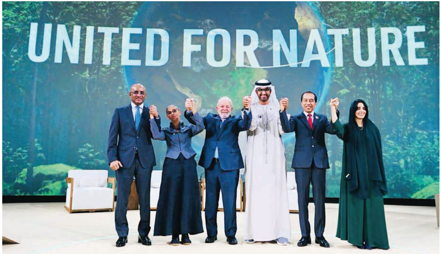
Presiden Jokowi usai berbicara di Presidency Session on Protecting Nature for Climate, Lives, and Livelihoods dalam World Climate Action Summit (WCAS) COP28 di Al Waha Theatre, Expo City Dubai, Dubai, Persatuan Emirat Arab (PEA), Sabtu, 2 Desember 2023.

mentary (Minister of Environment and Sustainable Development of the Democratic Republic of The Congo) dan Marina Silva (Minister of Environment and Climate Change of the Federative Republic of Brazil). Erick berbicara dalam bahasa Inggris, sementara dua menteri negara sahabat menggunakan bahasa negaranya masing-masing dan diterjemahkan oleh translaterannya. Menteri Erick menegaskan langkah serius dan kongkrit untuk menjaga dan melestarikan hutan, beberapa tahun terakhir. Antara lain mencegah kebakaran hutan, menekan deforestasi dan mengelola hutan masyarakat serta menjaga mangrove.