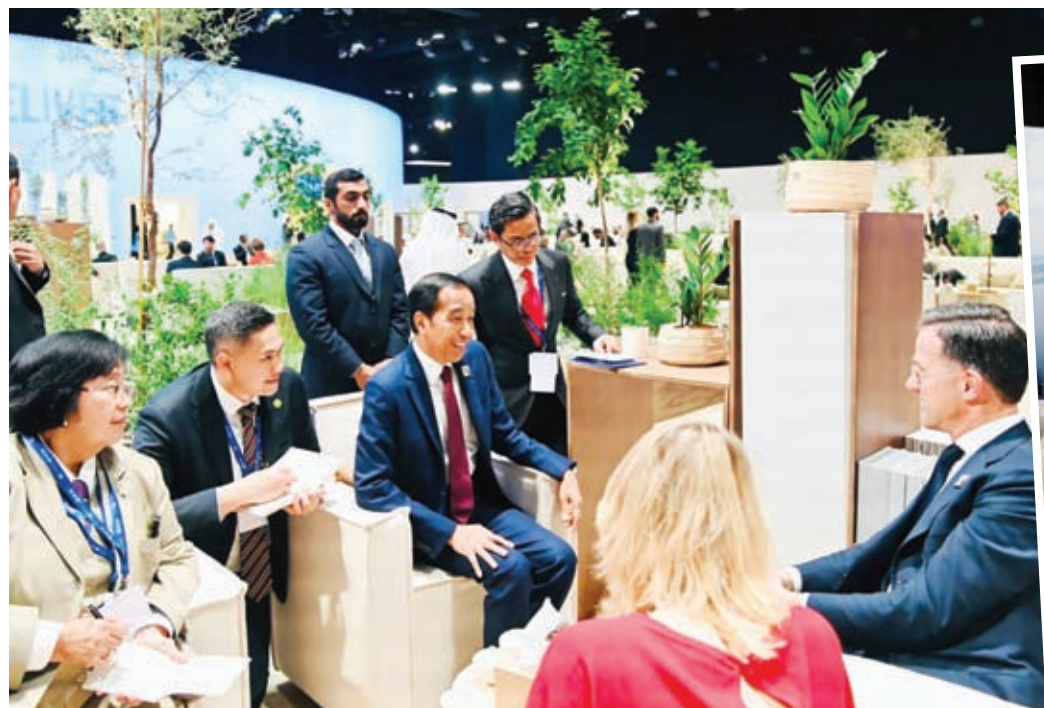
Presiden Joko Widodo banyak sekali melakukan pertemuan bilateral di COP28 Dubai. Salah satunya dengan PM Belanda Mark Rutte, Jumat, 1 Desember 2023 Menteri Lingkungan Hidup dan Kehutanan (LHK) Siti Nurbaya dan Wakil Menteri Luar Negeri Pahala Mansury mendampingi Presiden.

Menteri ESDM Arifin Tasrif dalam sesi lainnya menyebut tentang pengembangan pembangkit listrik tenaga hidro, yang penting sebagai tulang punggung strategi nasional dalam membangun ekonomi rendah karbon. Sebagian besar potensi pembangkit Hidro berada di negara berkembang dan belum dimanfaatkan secara maksimal.